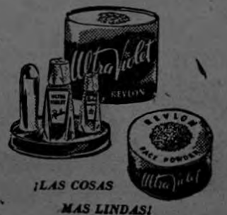
¡LAS COSAS MAS LINDAS!

Nuevo, fascinante, inimitable... ¡Haga la prueba hoy mismo! Queda bien en toda oportunidad, a cualquier hora, con cualquier vestido... Es increíblemente hermoso... es maravillosamente sentador... ¡es Revlon y está dicho todo!